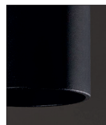
.02 Nero - Black