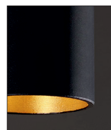
.02.29 Nero foglia oro Black gold leaf