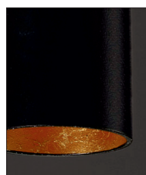
.02.28 Nero foglia rame Black copper leaf