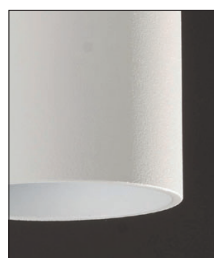
.01 Bianco - White