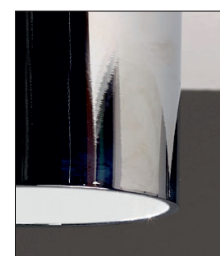
.31.02 Cromato -Bianco

A richiesta è possibile personalizzare EGOTUBE con differenti finiture. On request it is possible to customize EGOTUBE with different finishes.