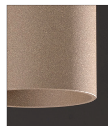
.35 Sabbia - Sand